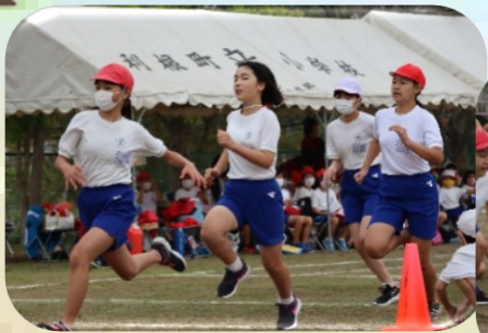
【ゴールに向かって駆け抜けろ！】 5・6年生