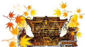
栃木県日光東照宮