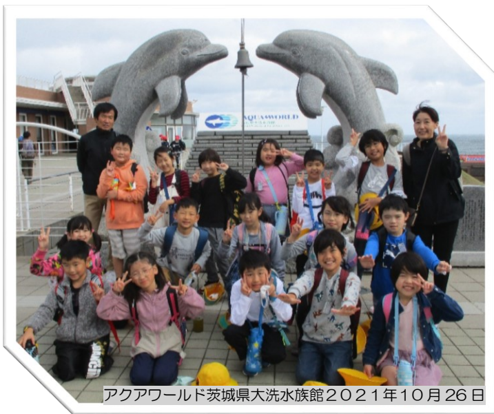
アクアワールド茨城県大洗水族館2021年10月26日