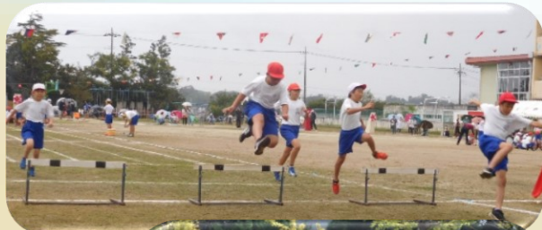
【げげげ！何ができるかな？】 5・6年生