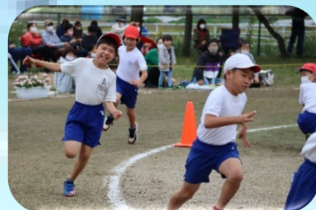
【走れ！ Fumi Kids】 3・4年生