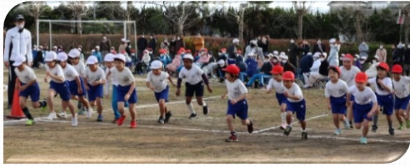
真剣勝負！元気一杯の3、4年生