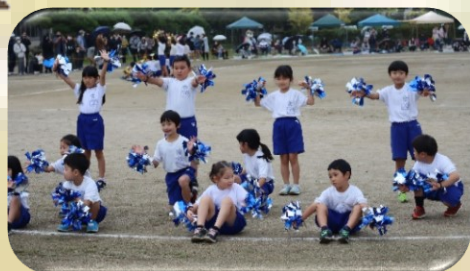
【ふみ出せ未来へ】 1・2・3年生