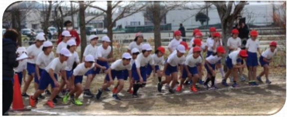
迫力満点！最後まで全力を出し切った5、6年生